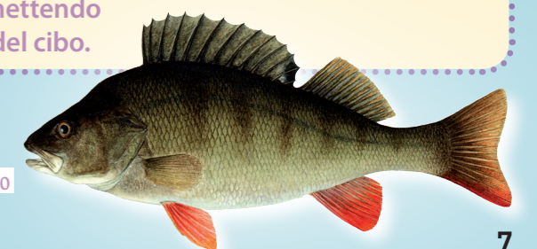
11 Pesce persico

Alcuni uccelli, invece, trascorrono qui l'inverno. Per difendersi dal freddo rizzano le penne, che così gonfie li tengono al caldo come se indossassero uno spesso giubbotto. Quando fa molto freddo e il terreno è tutto gelato è importante aiutare gli uccelli stanziali mettendo a loro disposizione del cibo.