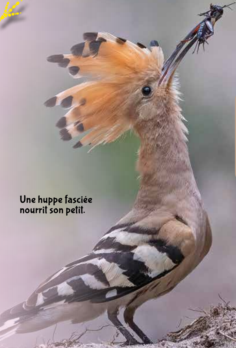
Une huppe fasciée nourrit son petit.

Déterminer l'espèce d'oiseau Si l'oiseau doit être nourri, tu dois absolument être en mesure de déterminer l'espèce d'oiseau. En effet, il existe des oiseaux strictement herbivores et des oiseaux carnivores. Le centre d'accueil pour oiseaux de ta région peut t'aider (envoie une photo).